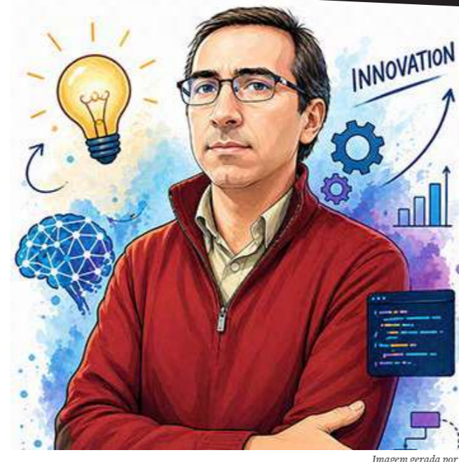
Imagem gerada por IA

A Inteligência Artificial não substitui o pensamento humano, mas sim complementa-o. Usada com critério, pode ser uma aliada poderosa. A chave está no equilíbrio entre tecnologia, conhecimento e responsabilidade.