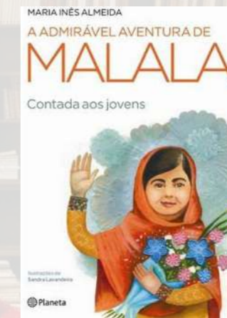
A ADMIRÁVEL AVENTURA DE MALALA INFANTOJUVENIL/BIOGRAFIA