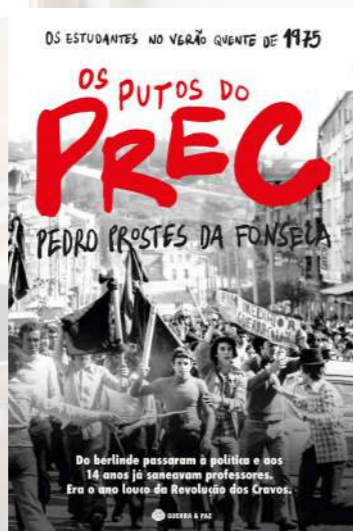
OS PUTOS DO PREC – OS ESTUDANTES NO VERÃO QUENTE DE 1975 HISTÓRIA CONTEMPORÂNEA

25 de Abril faz parte da história recente de Portugal e continua a lembrar-nos da importância da liberdade e das mudanças que a tornam possível. Nesta edição da E.BEL, reunimos livros que passam por diferentes histórias de superação, desde episódios marcantes do país a percursos pessoais que atravessam fronteiras e gerações. Entre a resistência, a descoberta e a luta por direitos, estas leituras mostram que a liberdade assume muitas formas, e que cada percurso, individual ou coletivo, contribui para a sua construção. E como sempre, os colaboradores do Grupo BEL têm 30% de desconto em todas as sugestões do mês.