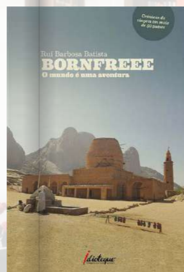
BORNFREEE – O MUNDO É UMA AVENTURA VIAGEM/BIOGRAFIA

“Os Putos do PREC – Os Estudantes no Verão Quente de 1975”, de Pedro Protes da Fonseca, retrata o papel dos jovens estudantes durante um dos períodos mais intensos da história recente de Portugal. Através de testemunhos e relatos, o autor mostra como alunos do liceu viveram e participaram ativamente nos acontecimentos do verão de 1975, num contexto de mudança política e social profunda. Uma leitura que dá voz a uma geração que cresceu em liberdade.